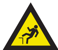
Pic. 326 Trede