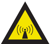
Pic. 311 Niet-ioniserende straling