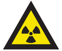
Pic. 304 Radioactieve stoffen of ioniserende straling