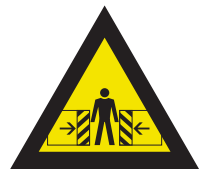
Pic. 316 Waarschuwing voor bekneld raken