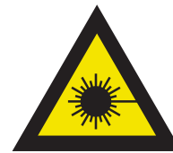
Pic. 309 Laserstraal