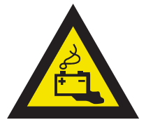
Pic. 310 Gevaren door accu's