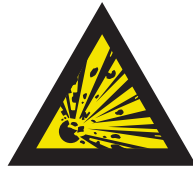
Pic. 301 Explosieve stoffen