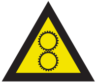
Pic. 299 Gevaar voor draaiende onderdelen