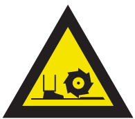
Pic. 318 Frees-as