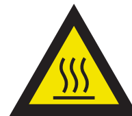
Pic. 315 Warm oppervlak