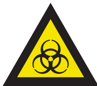
Pic. 312 Biologisch besmettingsgevaar