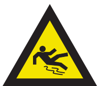
Pic. 324 Slijpgevaar