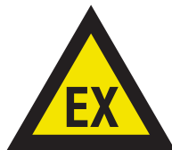
Pic. 313 Atmosfeer met ontploffingsgevaar