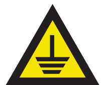
Pic. 329 Aarding

Pictogrammen standaard verkrijgbaar in de maten 50, 100 en 200 mm