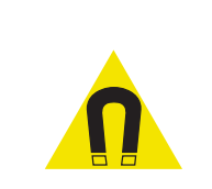
Pic. 322 Sterk magnetisch veld