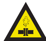
Pic. 328 Stoom onder hoge druk