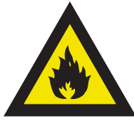
Pic. 300 Brandgevaarlijke stoffen