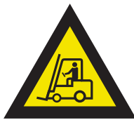
Pic. 306 Industriële voertuigen