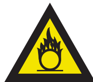
Pic. 314 Oxyderende stoffen