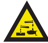
Pic. 303 Bijtende (corrosieve) stoffen