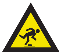
Pic. 325 Struikelgevaar