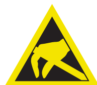
Pic. 327 Voor statische lading gevoelige componenten