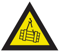
Pic. 305 Hangende lasten