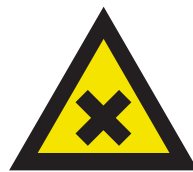
Pic. 321 Schadelijke of irriterende stoffen