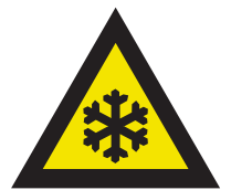
Pic. 323 Lage temperaturen