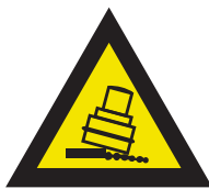
Pic. 319 Kantelgevaar