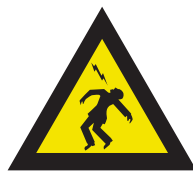
Pic. 320 overslaande spanning