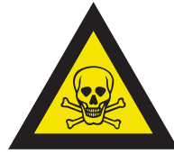
Pic. 302 Giftige stoffen