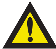
Pic. 308 Opgelet gevaar